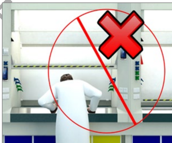
图 2 安全距离及禁止的危险行为