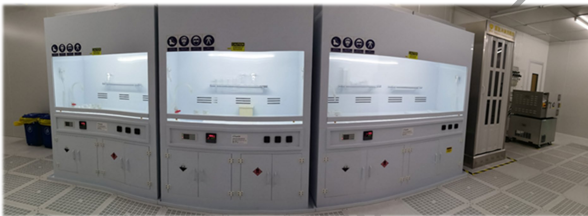
图 8 通风橱位置 (中)