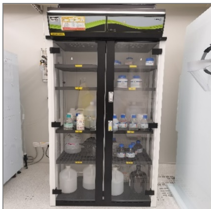
图 3 化学药品存储柜