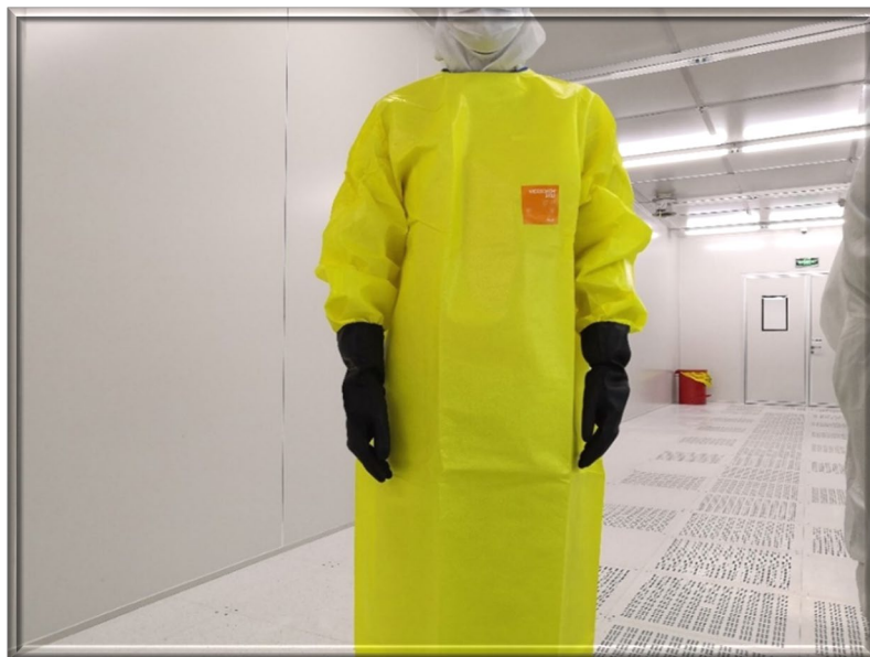
图 1 处理样品时所需的防护服及专用手套示意图