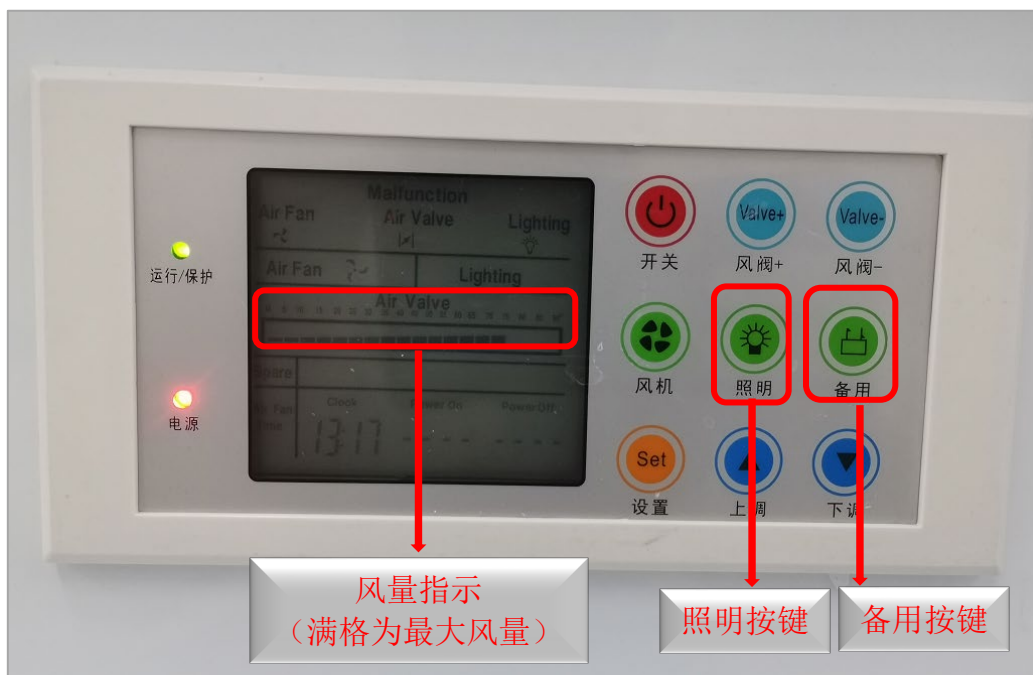
图 10 操作界面图片