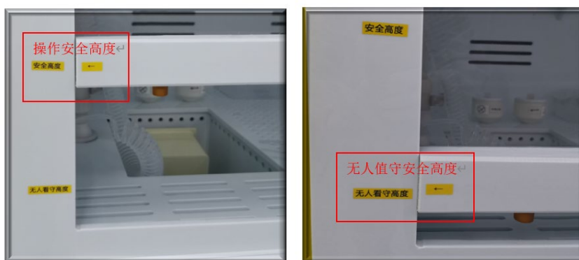
图 5 通风橱面板的规范高度