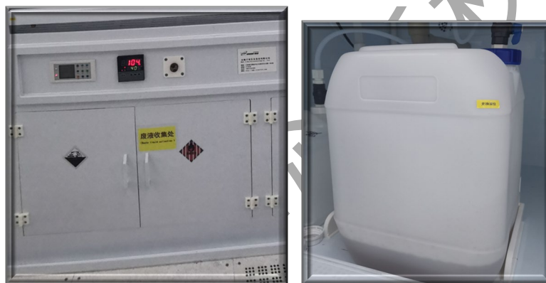
图 7 通风橱下方酸废液桶位置